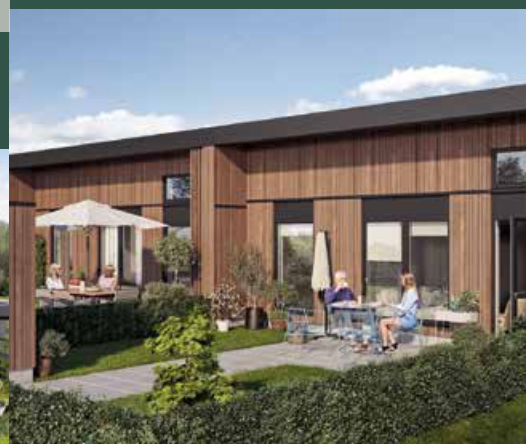
Højgårdsbakken i Ullerslev