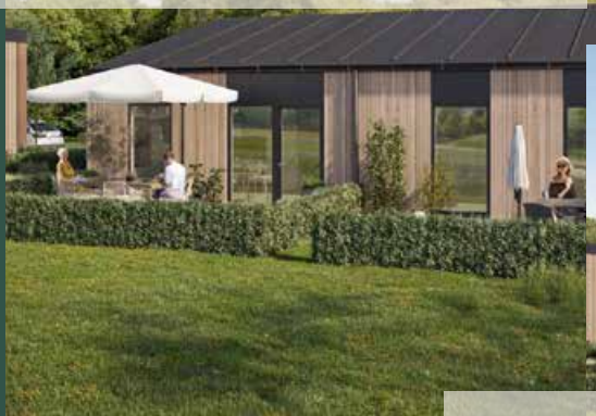
Sletteskoven i Nr.Bjert