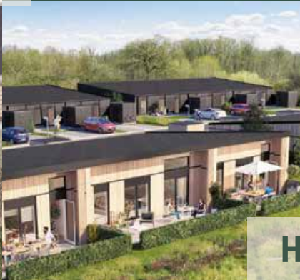
Højgårdsbakken i Ullerslev