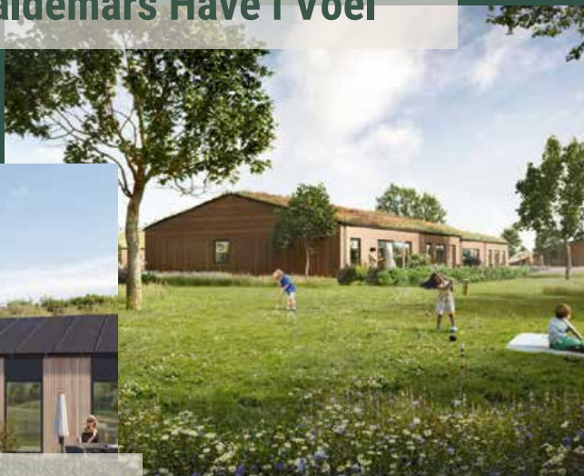
Valdemars Have i Voel