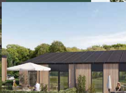
Skovlunden i Stenlille